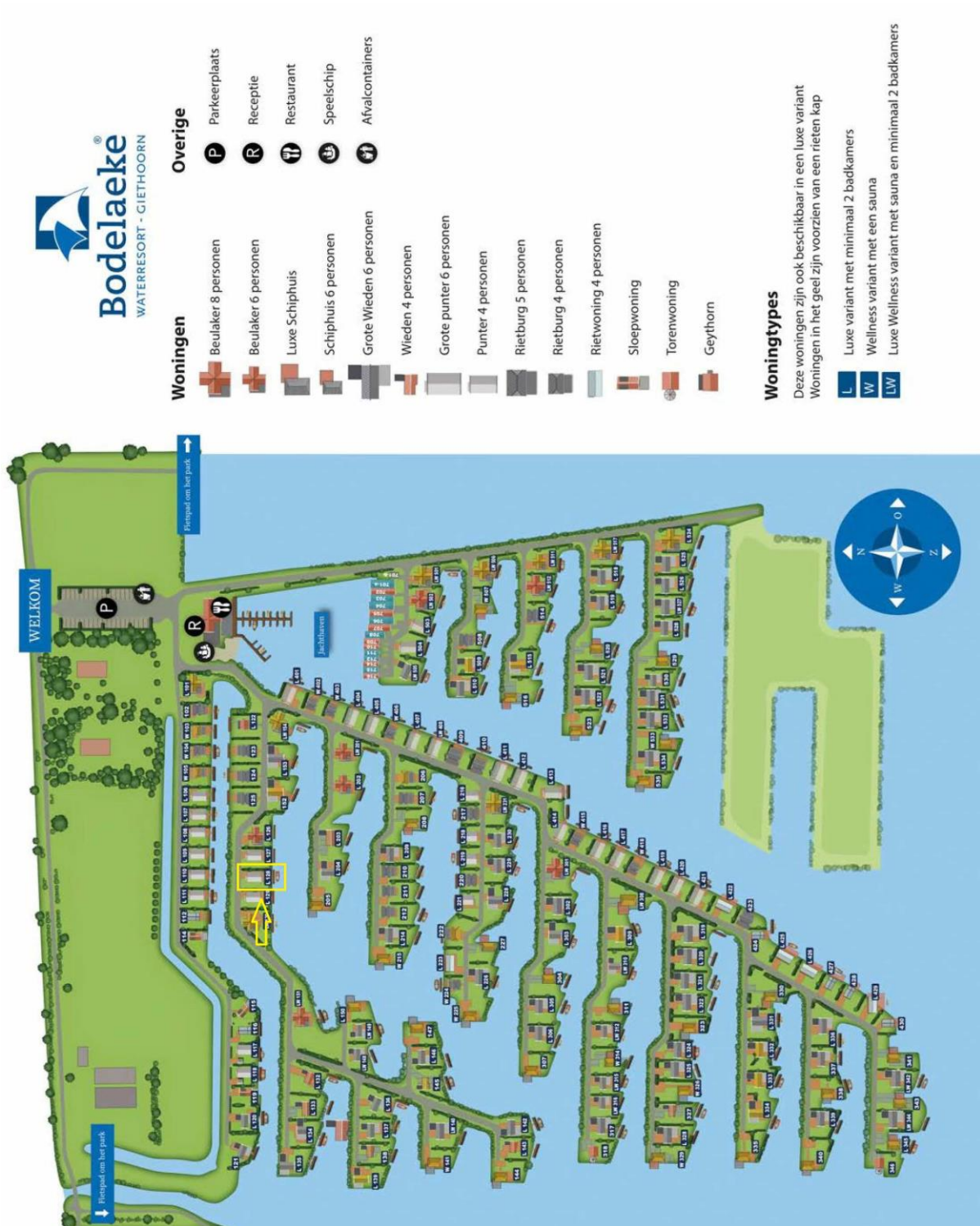
Plattegrond waterresort "Bodelaeke"